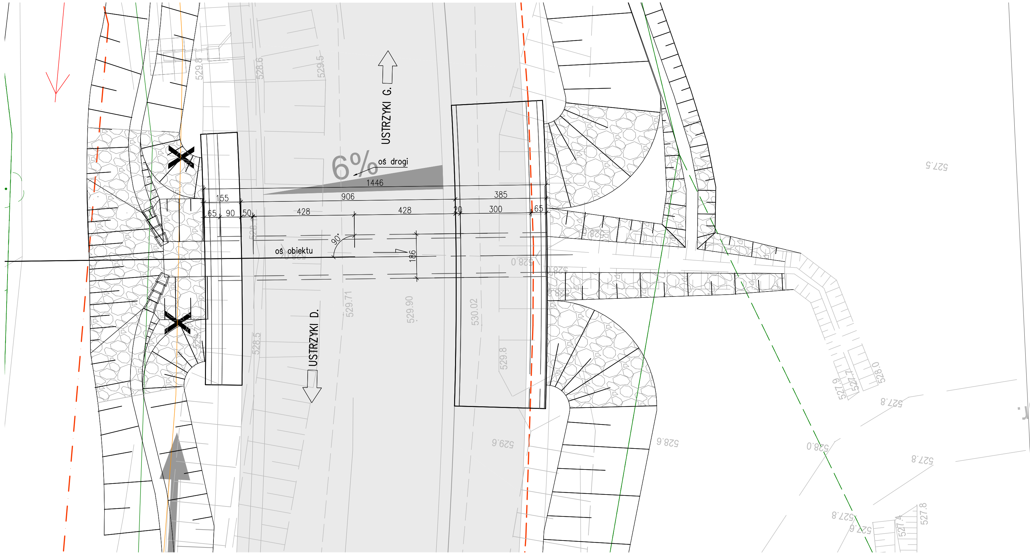
Widok z góry SKALA 1:100